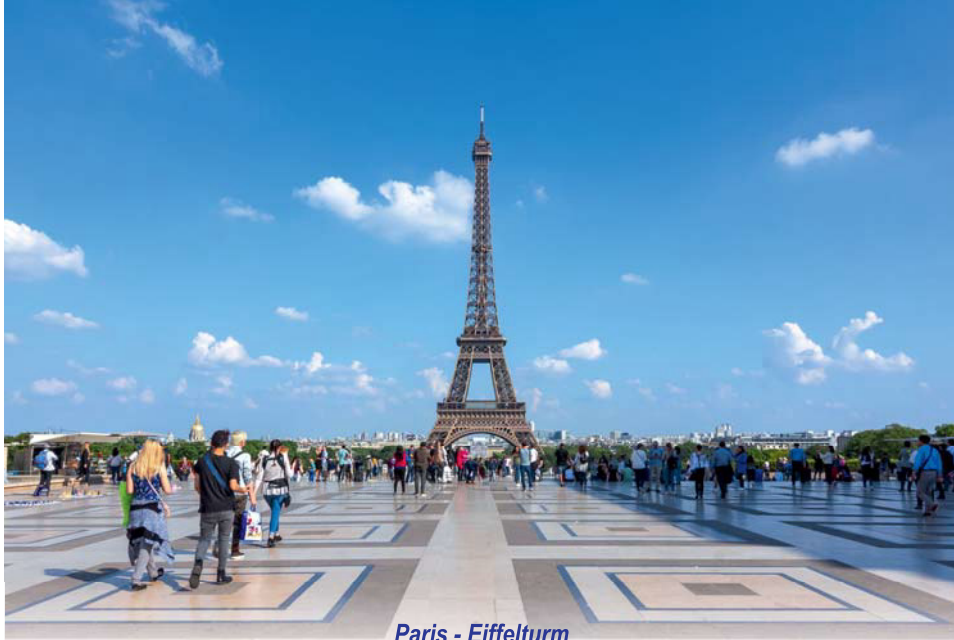
Paris - Eiffelturm